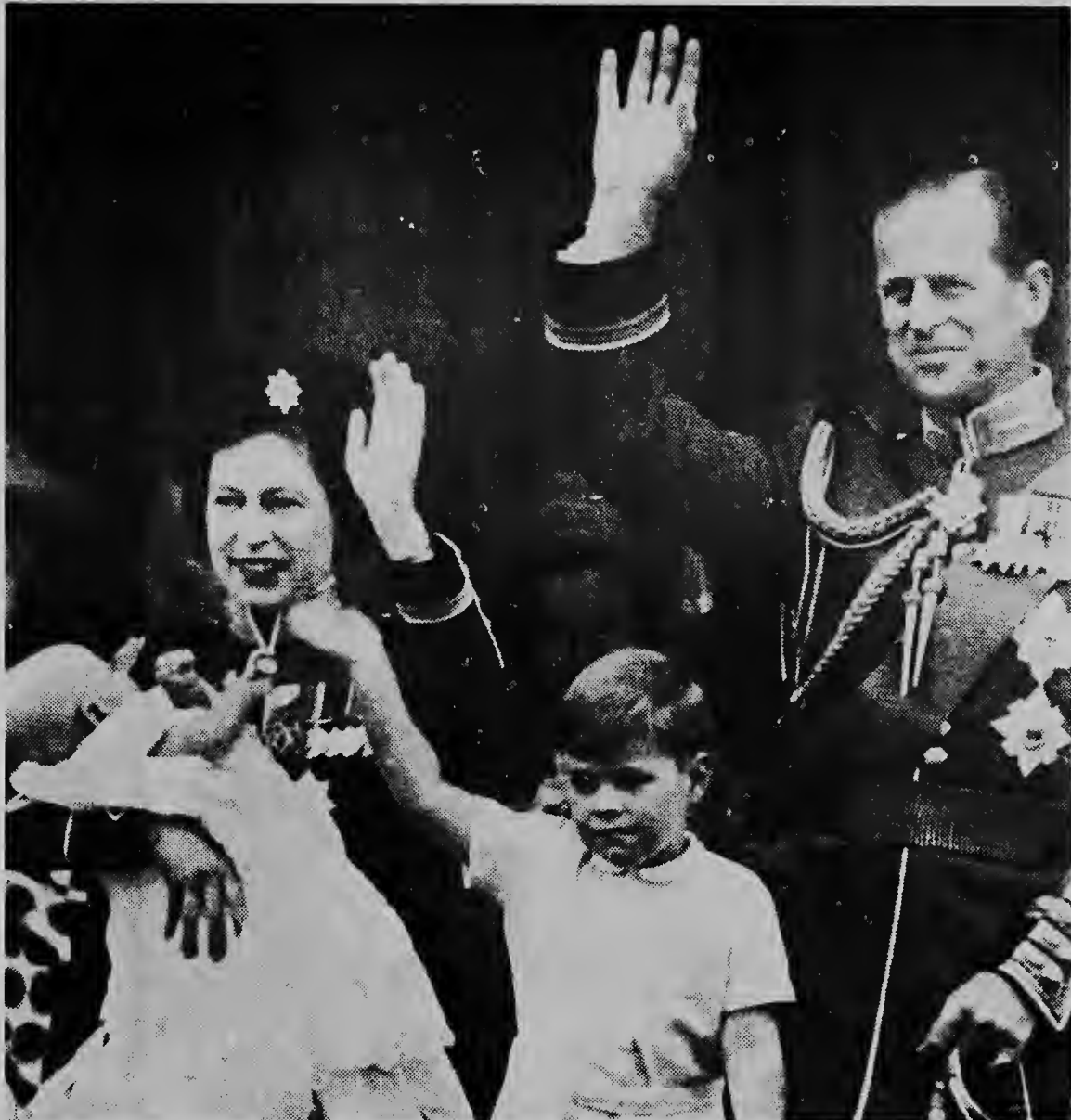
Reina Elisabeth di Inglatera ta tene su jiu homber di tres luna, prins Edward den su brazanan riba e balcon di Buckingham Palace despues di "Trooping the colour" dia 13 di Juni. Den centro prins Andrew di cuater anja y prins Philip.

Di fuente sindicalista a ser participa cu actualmente cinco mil persona ta huelga y cu actualmente no ta corre trein den shete estado, entre otro Nebraska, Kansas, Missouri, Oklahoma, Arkansas, Texas, y Louisiana. Den varios di esakinan nan ta terminando cu coseha di trigo.